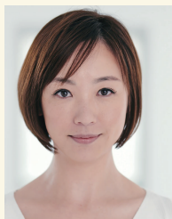
智順 (ユンジェの母さん)